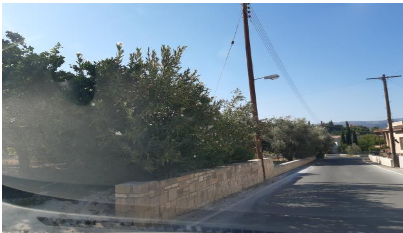
Ακίνητο με αρ. εγγραφής 0/3998