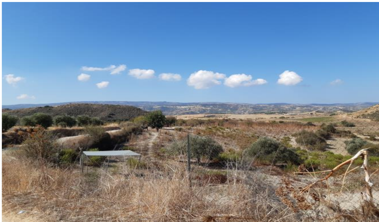
Ακίνητα αρ. εγγραφής 0/3892, 0/2703