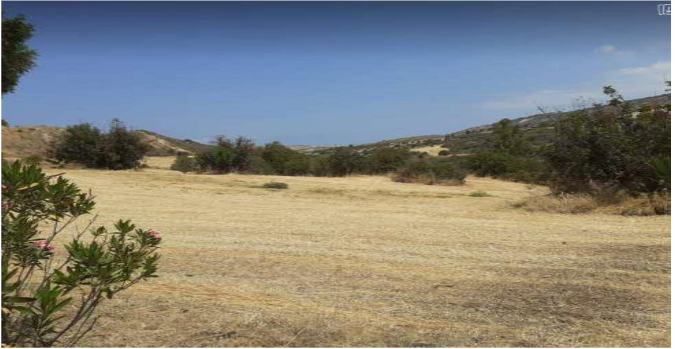
Ακίνητο με αρ. εγγραφής 0/4263