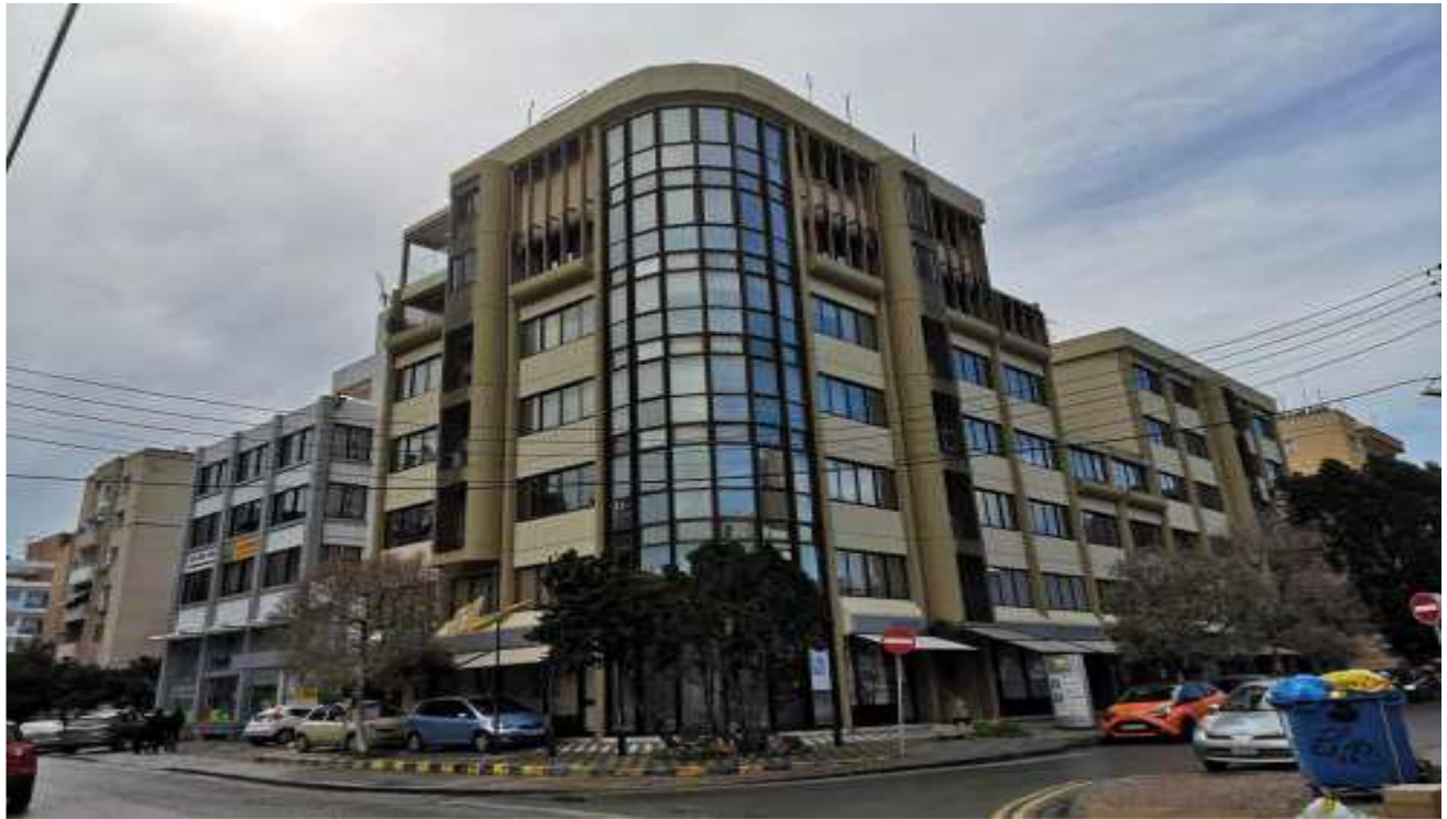
Γραφείο αρ. εγγραφής 3/2717